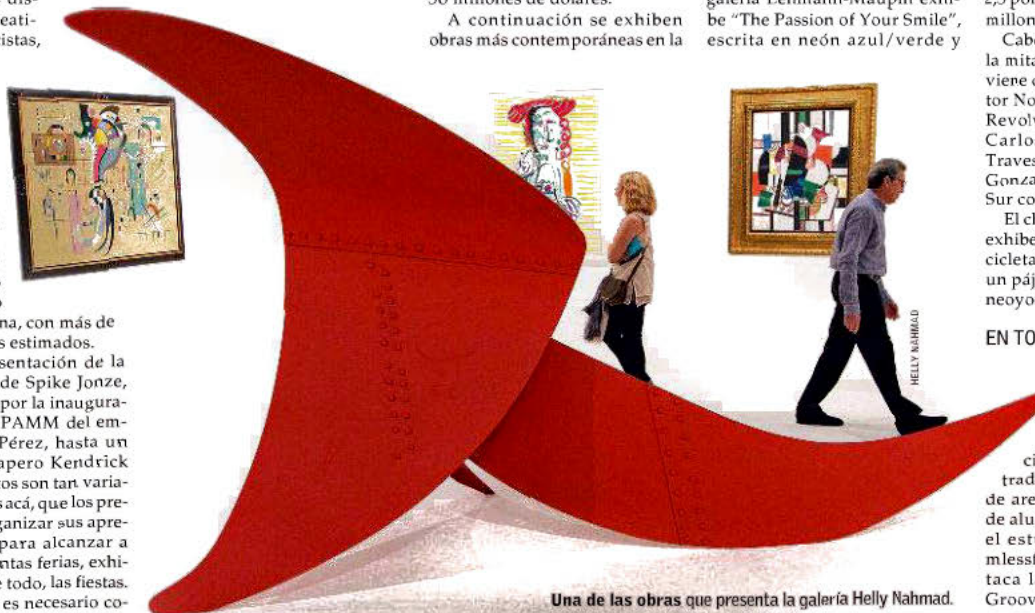
Una de las obras que presenta la galería Helly Nahmad.

Pero más allá de estas decepciones, ya se considera necesario en el ambiente artístico que se debe estar en Art Basel Miami Beach.